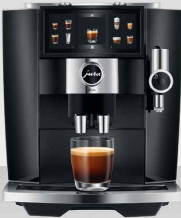
J8 twin Diamond Black (EA)