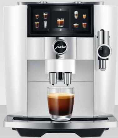
J8 twin Diamond White (EA)

De J8 twin van JURA is uitgerust met twee krachtige conische molens. Door twee koffiemachines in één te combineren, is dit de eerste in de compacte klasse die het beste biedt van twee werelden. Twee verschillende bonenvariëteiten worden gebruikt om met één druk op de knop unieke dranken te creëren, puur of gemengd. Met de J8 twin is er ook de mogelijkheid om gekozen dranken af te werken met delicaat gezoet melkschuim, waardoor een geheel nieuwe smaakwereld wordt geboden. Zwitserse technische expertise met de modernste technologie, zoals de P.A.G.3-molen en de Sweet Foam-functie.