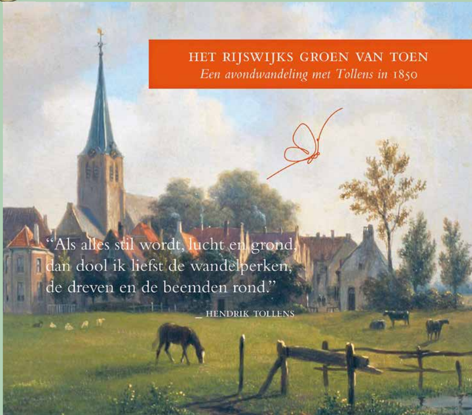
HET RIJSWIJKS GROEN VAN TOEN Een avondwandeling met Tollens in 1850

“Als alles stil wordt, lucht en grond, dan dool ik liefst de wandelperken, de dreven en de beemden rond.”