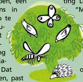
Leeuwendaal duurzaam en groen

Het “Rijswijks Groen van Toen, een avondwandeling met Tollens in 1850” is voor een paar euro te koop in de winkel van het Museum Rijswijk. De opbrengst komt ten goede aan het Museum – een welkome aanvulling op het door magere coronajaren sterk geslonken budget. Dat dit boekje hier komt te liggen, past ook in de hoofddoelen van de stich-