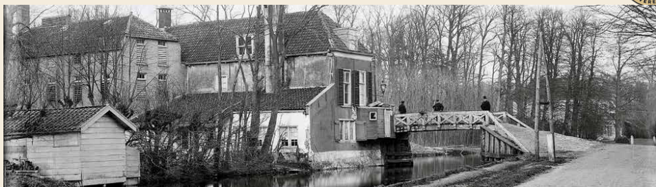
't Huys Burchvliet met de brug over de Delftse Vliet

pleet nieuwe brug op dezelfde plek of een nieuwe brug in plaats van de oude en de historische brug verplaatsen naar Park Vreugd en Rust. De Rijksdienst voor Cultureel Erfgoed wees op de nadelen, namelijk dat de plannen de cultureel-historische en architectonische waarde zouden verstoren. Vanwege het bruggetje en bijbehorende huisje zelf. En omdat ze een geheel vormen met andere bruggen over de Vliet.