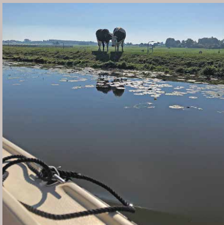
Hollands tafereel vanaf het water (vanuit Vlietland)

Vanaf de Nijverheidsstraat kun je zelf lekker gaan varen met een boot van Bootver-