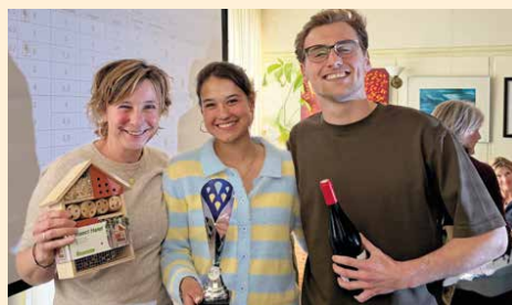
Het winnende team Bomenbuurt, import

Kortom: een fantastische middag die zeker voor herhaling vatbaar is. Op naar de volgende pubquiz!