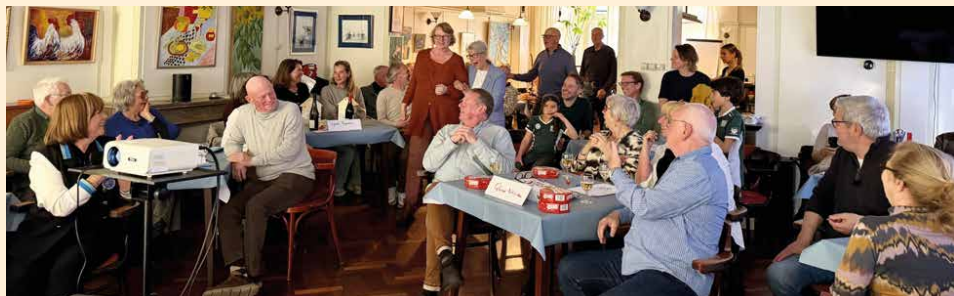
Overzicht van de deelnemers