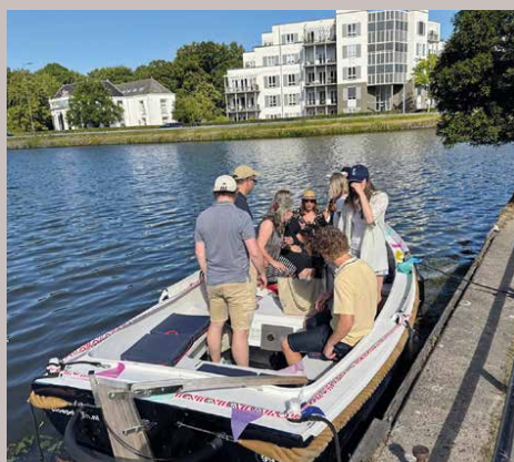
Aanmeren en instappen bij de Hoornbrug

huur Haaglanden of via Sloepdelen. Er zijn verschillende soorten boten te huur voor groepen van zes tot en met twaalf personen. Vooral de elektrische sloepen zijn fijn en lekker stil. Reserveren en betalen gaat makkelijk online.