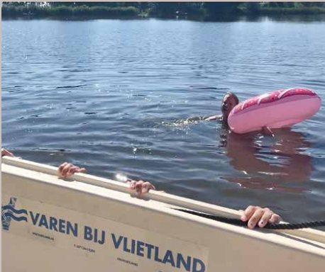
Zwemmen bij de Noord Aa vanaf Vlietland

voor het uitbreiden van tours volgend jaar. Denk aan een 'art and graffiti'-rondvaart of een proeverij op het water samen met brouwerij Kompaan.