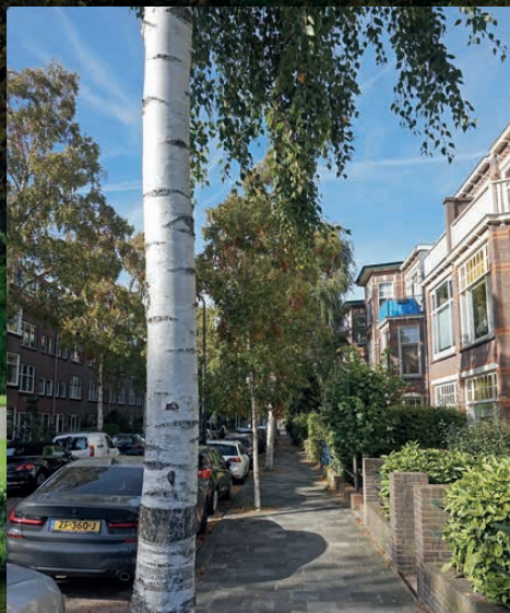
Elk huis kijkt uit op 3 bomen

“Plant more trees” roept de Europese Unie ons op. Tegen hitte als gevolg van klimaatverandering, voor de opvang van stikstof. Maar de ene boom is de andere niet. Het gaat om kwaliteit: de juiste boom op de juiste plek om de juiste reden. ‘We moeten