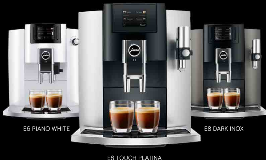
E6 PIANO WHITE